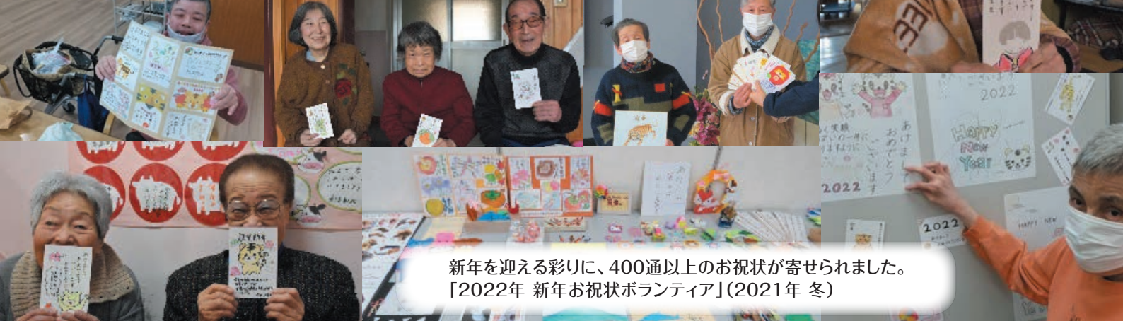
新年を迎える彩りに、400通以上のお祝状が寄せられました。 「2022年 新年お祝状ボランティア」(2021年 冬)

※ペンパーボランティアとは、岐阜市ボランティアセンターがコロナ禍を機に提案している、ペン(えんぴつ)とペーパー(紙)さえあれば、いつでも誰でもどこでも参加できる活動です。