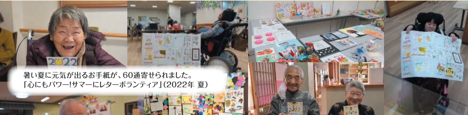
暑い夏に元気が出るお手紙が、60通寄せられました。 「心にもパワー!サマーにレターボランティア」(2022年 夏)

発行 社会福祉法人 岐阜市社会福祉協議会 発行日◇令和4年9月15日 〒500-8309 岐阜市都通2丁目2番地 岐阜市民福祉活動センター内 TEL 058-255-5511(代表) FAX 058-255-5512 Eメール office@gifushi-shakyo.or.jp ホームページ http://www.gifushi-shakyo.or.jp