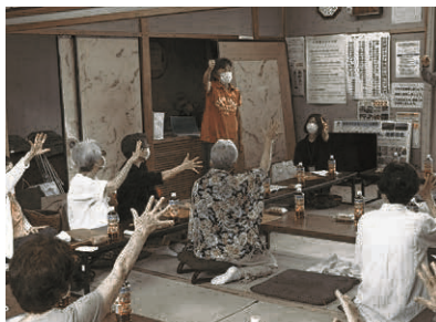
▲サロン見学の様子