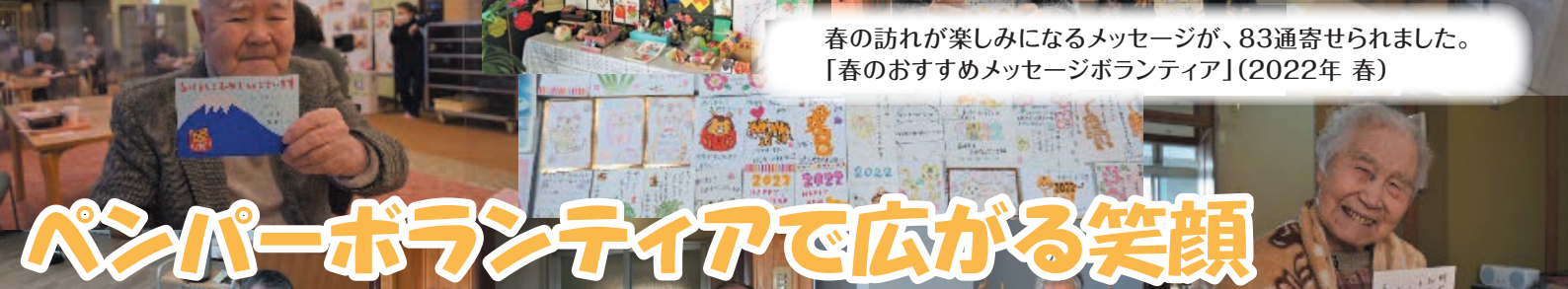
春の訪れが楽しみになるメッセージが、83通寄せられました。 「春のおすすめメッセージボランティア」(2022年 春)