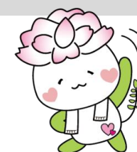
なごみん(岐阜市社協キャラクター)

高齢者ができる限り要介護状態になることなく、いつまでも健康で生き生きとした生活が送れるように介護予防教室を開催します。