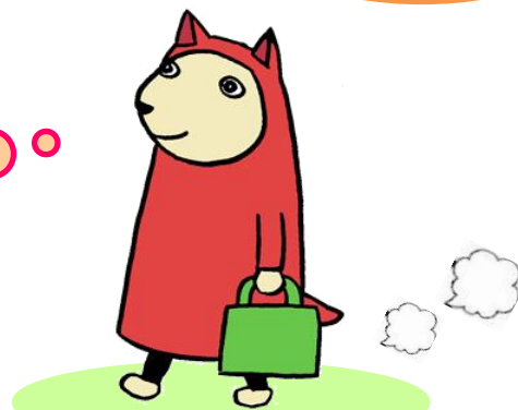
介護相談員キャラクター「クーちゃん」