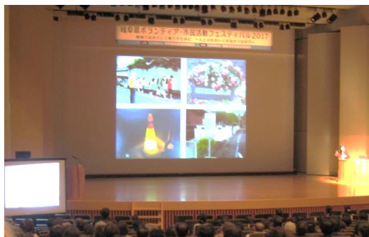
▲「住民が主役の助け合い活動～ボランティアの力をつむぐ～」というテーマの講演を聞きました。