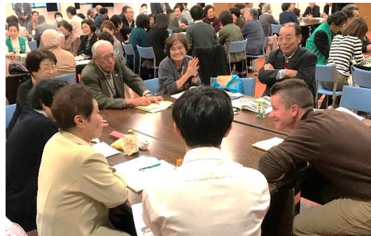
▲4つの分科会に分かれ、ボランティア・地域活動に関する発表を聞き、他市町村の方と交流をしました。