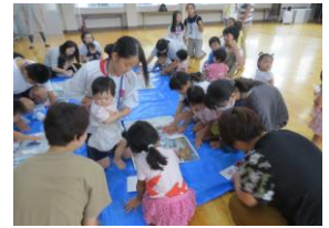
▲Gツインズの活動のお手伝い 双子ちゃんとふれあいました。