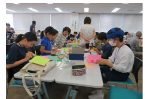
▲サロンにて地域の方と一緒にとびだすカード作りを行いました。