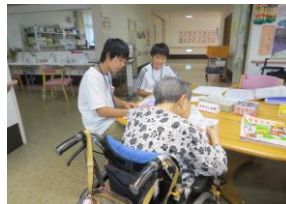
▲利用者さんとお話しながら脳トレ活動のお手伝いを行いました。お好み焼きづくりをしました。