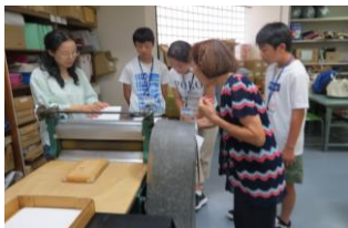
▲岐阜アソシアの活動に参加 点字印刷機の体験をしました。