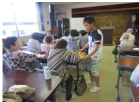
▲サロンにておやつのお手伝いを行いました。