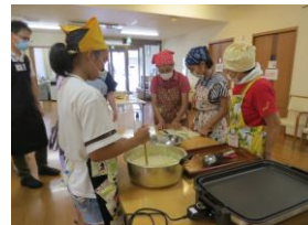
▲地域食堂のお手伝い