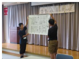
▲サロンにて歌やレクのお手伝い をしました。