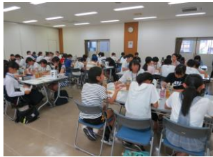
▲1日目のオリエンテーションの様子