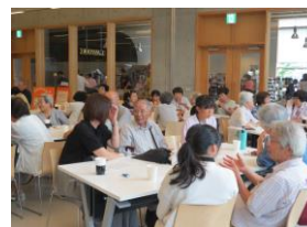
▲カフェのお手伝いをして高齢者 の方や地域の方と交流しました。