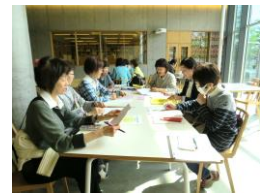
▲ミーティングの様子 (月1回実施)

ボランティアセンターの傾聴ボランティア養成講座を修了した方が集まり傾聴ボランティアの活動を始めました。 高齢者福祉施設、個人宅を訪問しての傾聴活動を行っています。 今年の5月に発足した新しいグループです。 傾聴に興味がある方、一緒に活動してみませんか?